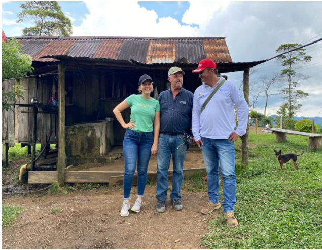
Figura 3 y 4. Beneficiarios de los proyectos de pagos por servicios ambientales.