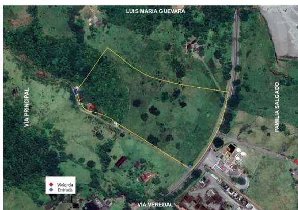
Figura 3 y 4. Delimitación predial e identificación de coberturas.